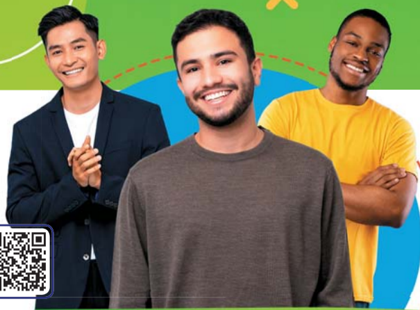
mezczyzni na swiecie