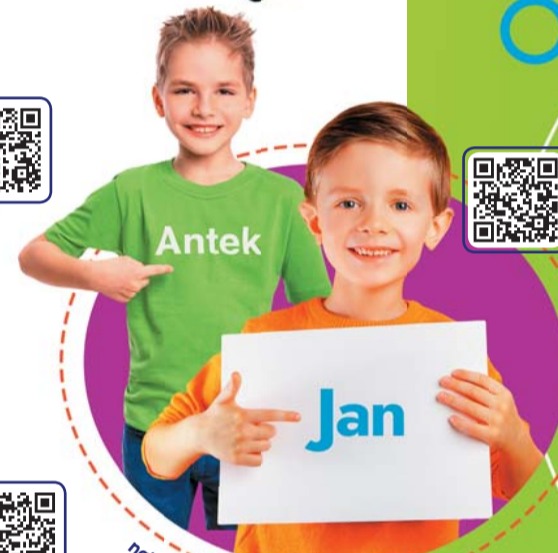
najpopularniejsze imiona męskie