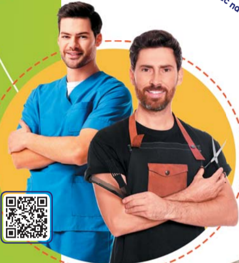
mezczyzni w pracy