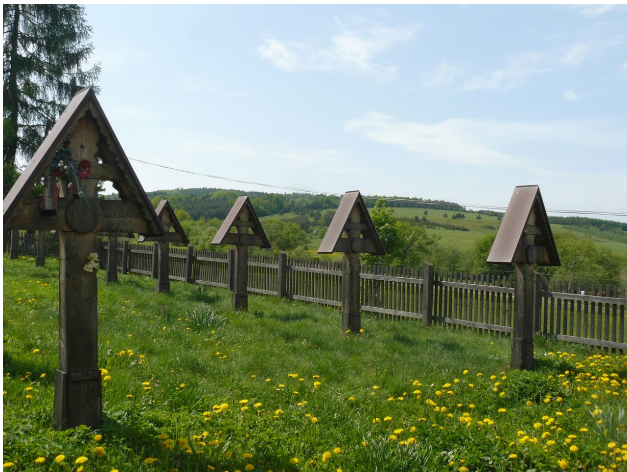
▲ Rosyjski cmentarz wojenny z I wojny światowej w Grabiu na Podkarpaciu. Widok współczesny.