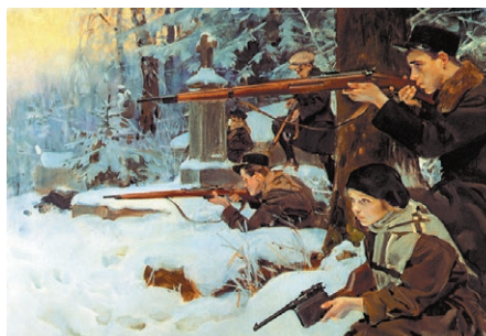
▲ Orlęta Lwowskie , obraz Wojciecha Kossaka z 1926 r. Nieznany żołnierz pochowany w arkadach Pałacu Saskiego został wybrany z grona obrońców Lwowa, poległych w latach 1918–1919.

Na czterech filarach arkad umieszczono tablice z nazwami pobojowisk z lat 1914–1920. Pod każdą płonął znicz w kształcie czary podtrzymywanej przez trzy boginie Nike. Od strony Ogrodu Saskiego przestrzeń między arkadami zamknięto ażurowymi kratami, ozdobionymi dwoma najważniejszymi polskimi odznaczeniami wojskowymi – Krzyżem Kawalerskim Orderu Virtuti Militari i Krzyżem Walecznych. Między nimi umieszczono znak Wojska Polskiego – orła na tarczy Amazołek.