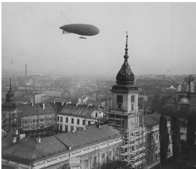
▲ Widok na Zamek Królewski w Warszawie w 1926 r.