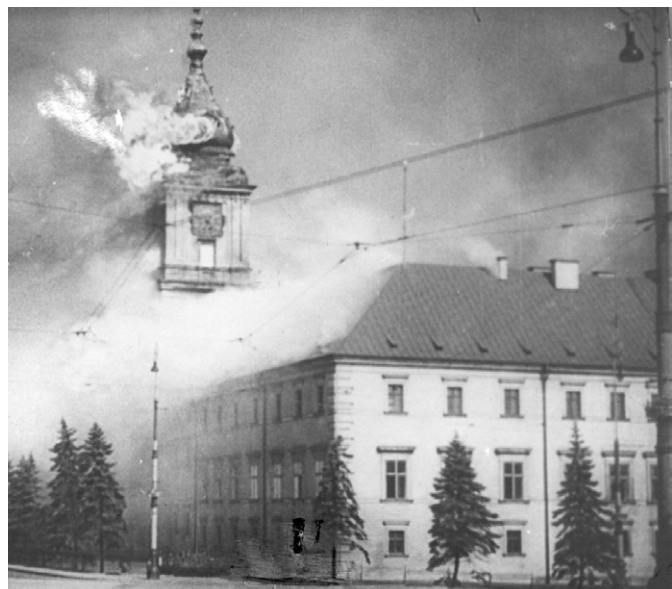
▲ Pożar Zamku Królewskiego w Warszawie po niemieckim bombardowaniu we wrześniu 1939 r.