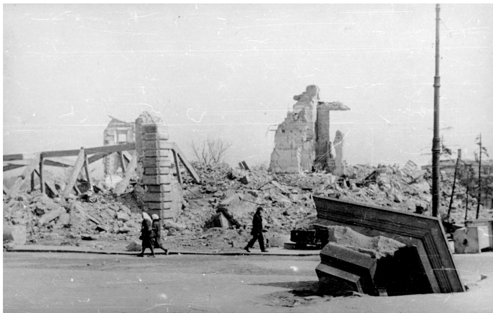
▲ Ruiny Zamku Królewskiego w Warszawie w 1945 r.