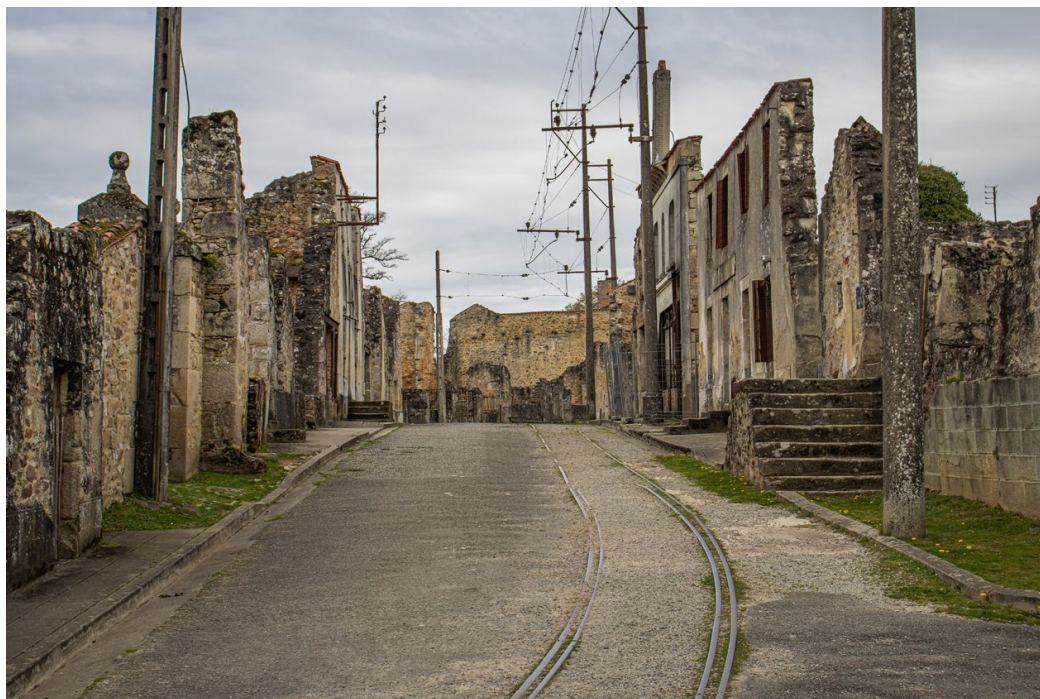
▲ Ruiny miejscowości Oradour-sur-Glane we Francji. Widok współczesny.